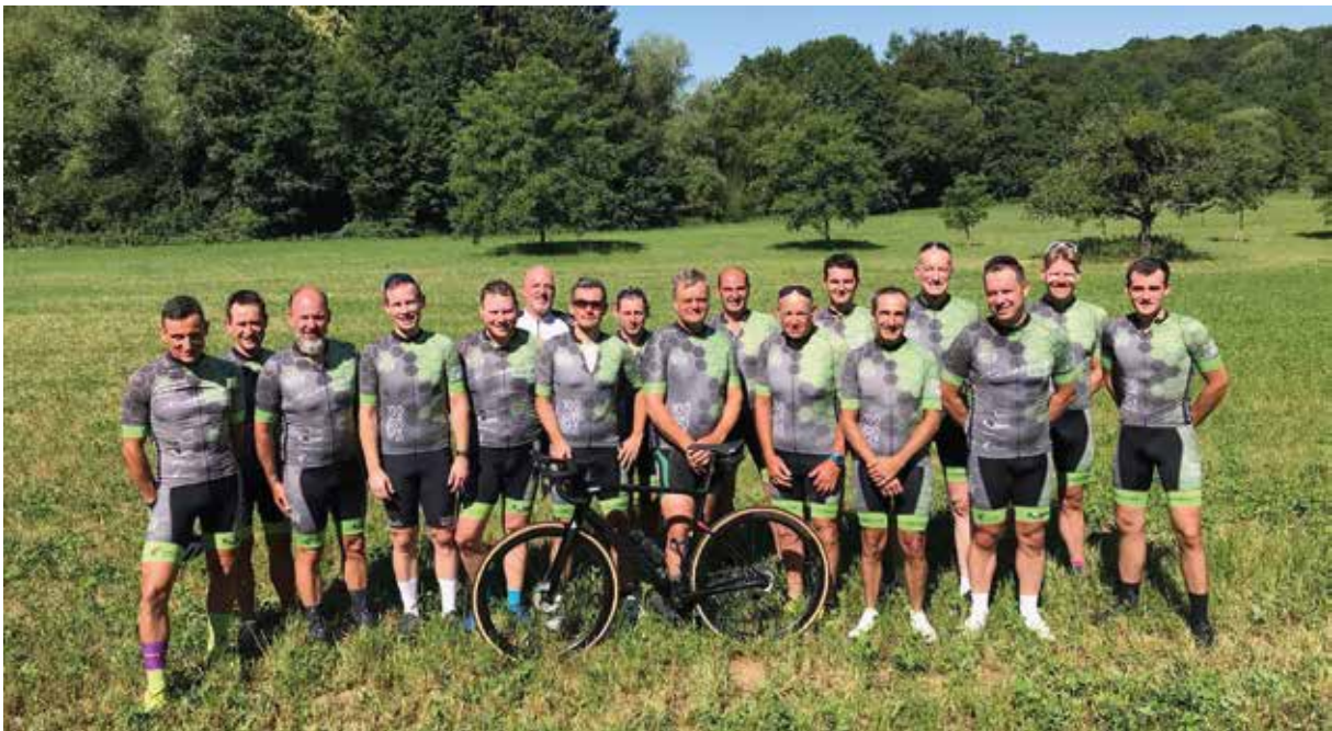
Teilnehmer RSV-Vereinsmeisterschaft 2023

Im März 2022 wurde das Kindertraining zur MTB-Rennförderung gestartet- die MTB-Kids Herbolzheim.